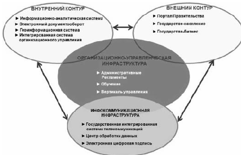
Рис. 3.1.1. Архитектура проекта «Электронного Правительства Республики Татарстан»

Первый - внутренний - контур включает в себя: межведомственную систему электронного до-кументооборота; информационно-аналитическую систему органов государственной власти; интегрированную систему организационного управления; геоинформационную систему органов государственной власти;