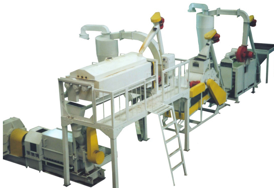
Рисунок 5 – Линия по производству растительного масла ЛМ-1.