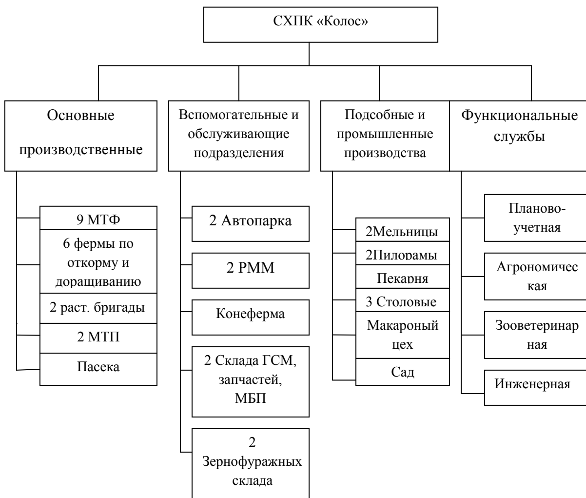
Рисунок 3.- Организационная структура СХПК «Колос»

Порядок взаимодействия подразделений управленческих служб определяется структурой управления, от которой напрямую зависит эффективность деятельности кооператива.