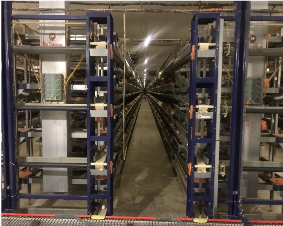
Рисунок А.1 – Общий вид клеточной батареи «Univent UV-L 550А»