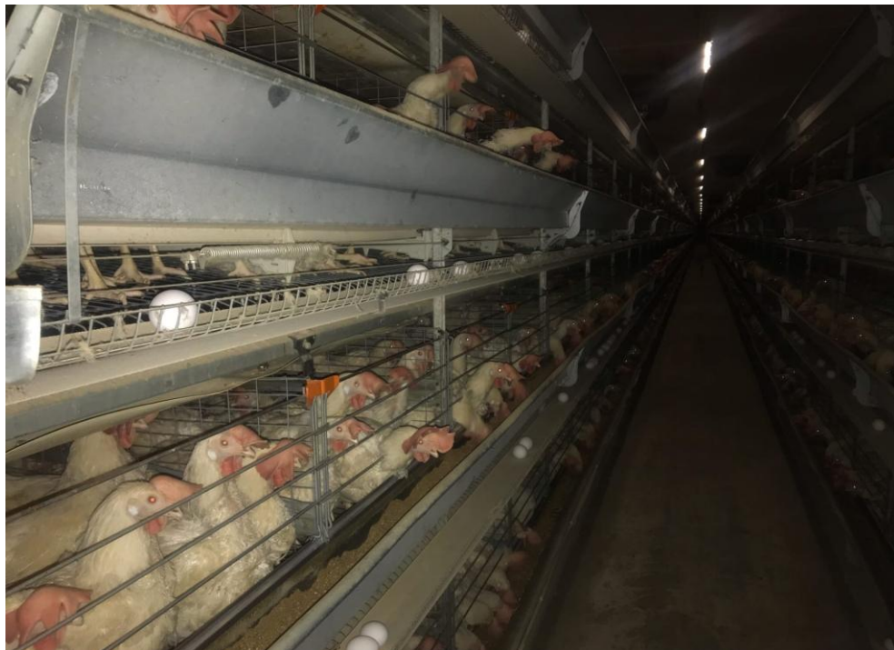
Рисунок А.2 – Куры-несушки кросса «Ломанн-ЛСЛ-Классик» исследуемых групп