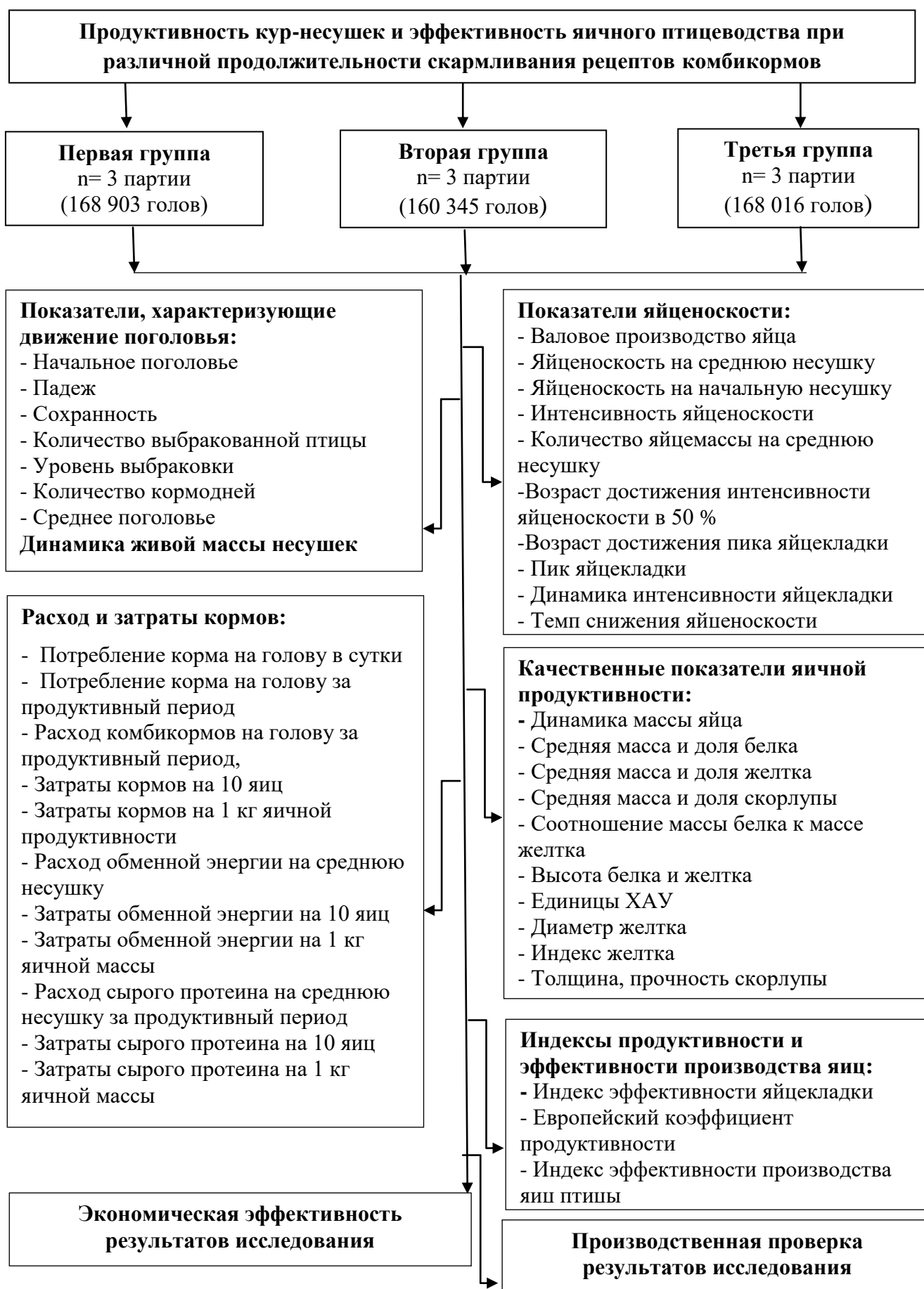
Рисунок 1 – Схема исследования