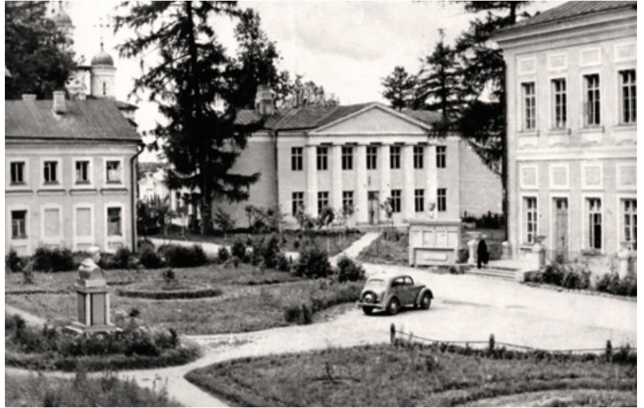
Учебные корпуса Московского зоотехнического института коневодства в Голицыно

Научно-технический прогресс в сельском хозяйстве требовал подготовки кадров новых специальностей. В 1977 году был официально открыт факультет электрификации и автоматизации сельского хозяйства, в 1984 году - экономический факультет, в 2000 году - лесохозяйственный факультет и фа-